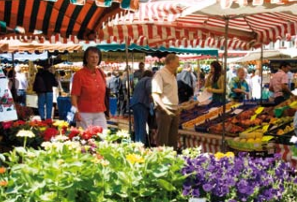
Buntes Treiben unter Göttern ...